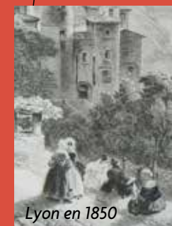
Lyon en 1850